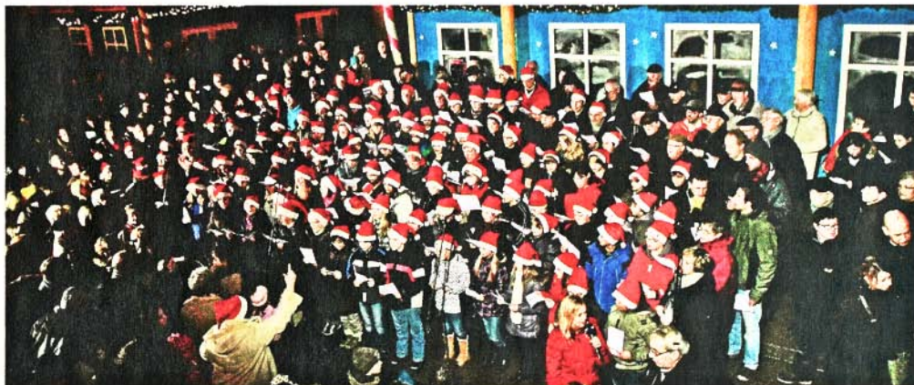
Der RWE-Chor und Schüler des Reinoldus-Schiller-Gymnasiums sorgten vor der Kulisse des Weihnachtsdorfes für Feststimmung – und viele Zuhörer sangen mit.

Beim letzten Lied „Stille Nacht, Heilige Nacht“ wurden dann alle Kerzen angezündet und gen Himmel gehalten. Es hätte keine bessere Vorbereitung für das große Fest geben können. thilo